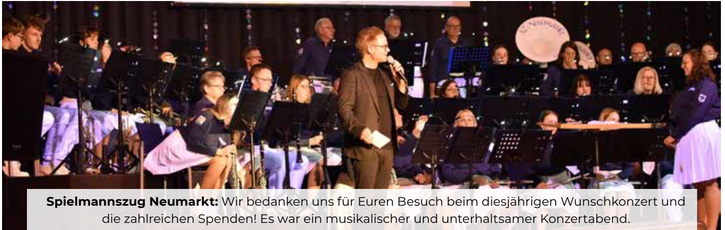
Spielmanszug Neumarkt: Wir bedanken uns für Euren Besuch beim diesjährigen Wunschkonzert und die zahlreichen Spenden! Es war ein musikalischer und unterhaltsamer Konzertabend.