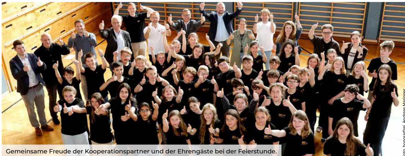
Gemeinsame Freude der Kooperationspartner und der Ehrengäste bei der Feierstunde.